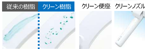
※詳細はカタログ参照

便座とノズルには、防汚効果の高いクリーン樹脂を採用。汚れをはじくから、汚れてもサッとひとふきでお手入れできます。