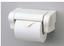
YH52R 紙巻器 (ワンタッチ式)